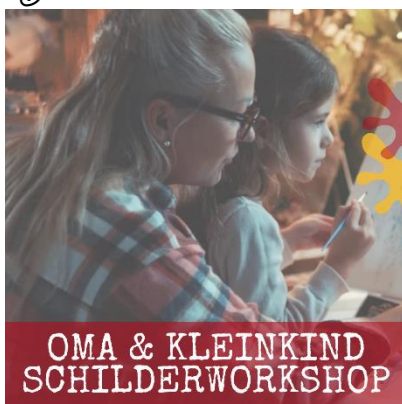
OMA & KLEINKIND SCHILDERWORKSHOP